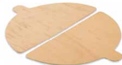
Palette per pizza incluse Pizza trays included